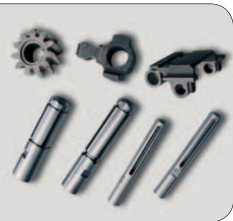
Mandrini ad espansione tipo SPIN Expansion Mandrel type SPIN